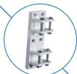
KONZOLA NA STĚNU